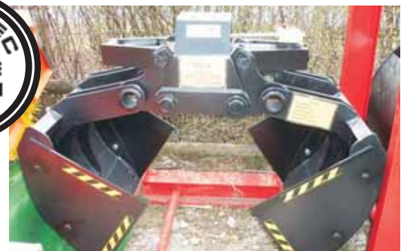
Utilisation benne preneuse- avec cotés fermés