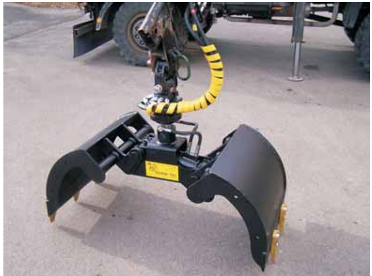
Grappin multifonction avec cotés ouverts et dents à visser