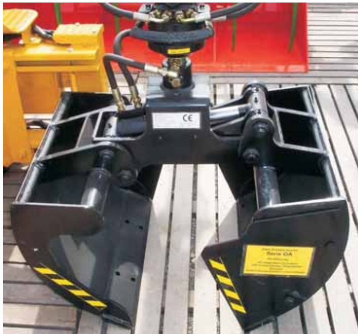
Les plaques de côté à visser permettent une grande polyvalence

ZBenne preneuse (ZG)- série OA avec vérin horizontal. Petite version avec plaques de côté fixables. Grappin multifonction avec un vérin pour la remise en état d'espaces verts.