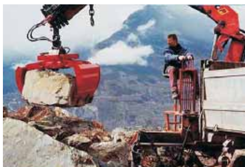
Utilisation grappin à pierres-avec cotés ouverts

Benne preneuse (ZG) série OB- avec vérin horizontal. Grande version avec cotés à visser. Grappin multiusages avec un vérin horizontal pour diverses utilisations avec des grues de camions ou des pelleuses. L'outil multifonctionnel pour votre grue.