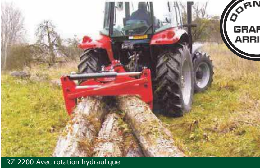
RZ 2200 Avec rotation hydraulique