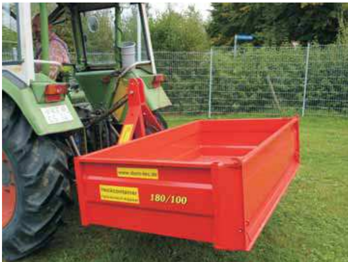
Version solide et stable avec porte basculante

Caisson arrière hydraulique avec hauteur de bennage extra haute. De série porte avant basculante! Un vrai fait tout pour le transport de sable, terre, gravier, fumier, balle de foin, plaquette, granulés, bois de chauffage etc. Différentes grandeurs en option.