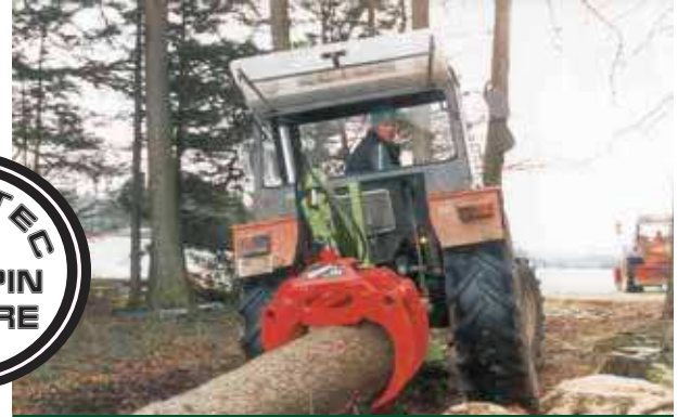
RG en forêt