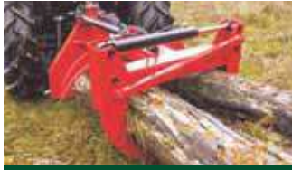
RZ 2200 au travail

Les pinces arrière sont utilisées pour débiter le bois en grumes . Débiter, charger et transporter avec un seul outil et sans descendre. En temps que pince de débiter avec fonction de chargement pour empiler ou comme pince de débiter avec rotation hydraulique pour rassembler rapidement.