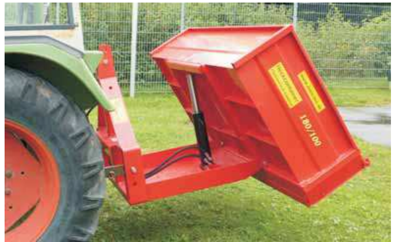
Version avec vérin renforcé