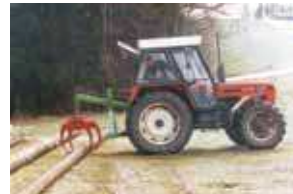
RG 1400 avec fonction de chargement