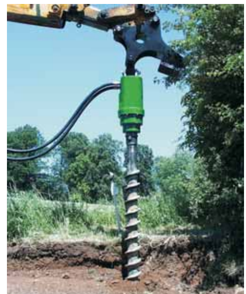
Grand choix en entrainement et en vis