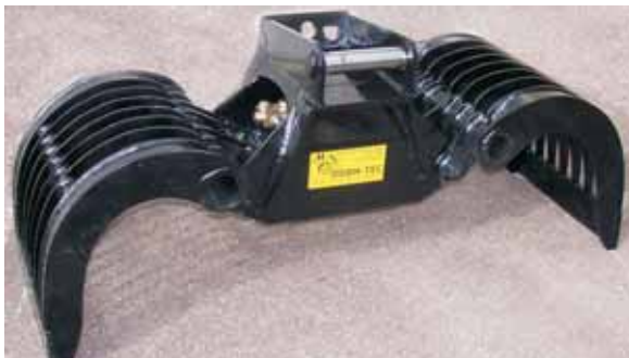
Grappin à pierre avec attache rapide