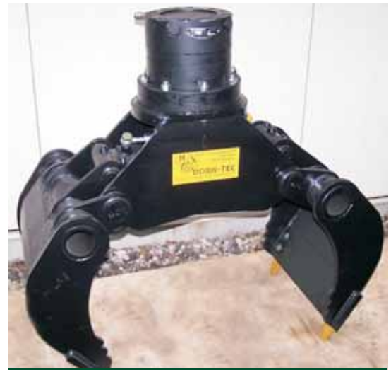
Série SG avec coquille fermée