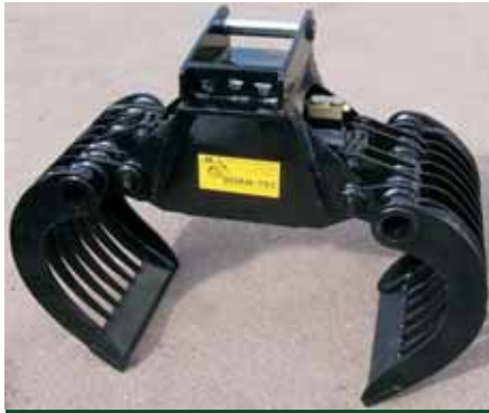
Série RC avec coquille avec barres