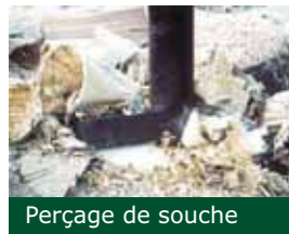
Perçage de souche