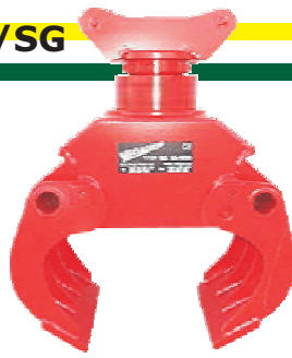
Grappin à pierres avec rotator fixe

Avec un/deux vérins horizontaux et une attache rapide ou rotator fixe pour des travaux de démolition ou de tri.