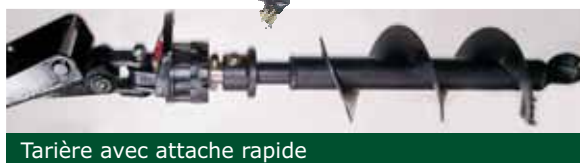
Tarière avec attache rapide