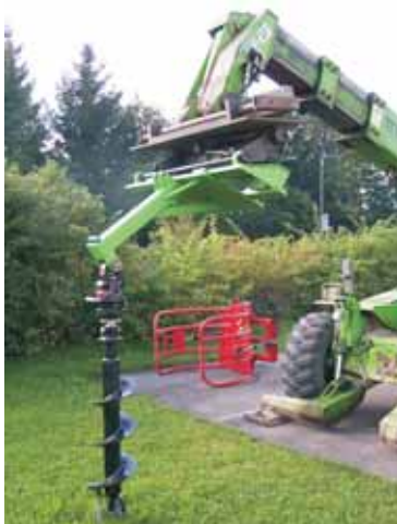
Montage sur chargeur frontal