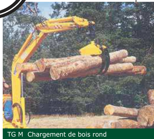
TG M Chargement de bois rond