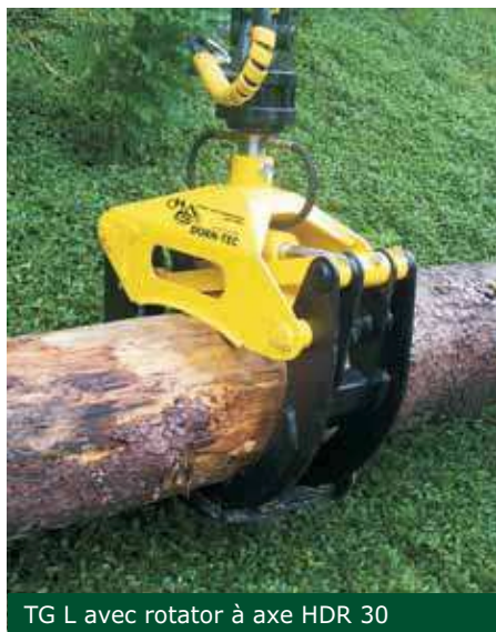
TG L avec rotator à axe HDR 30