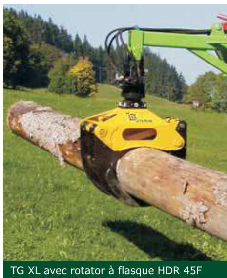
TG XL avec rotator à flasque HDR 45F