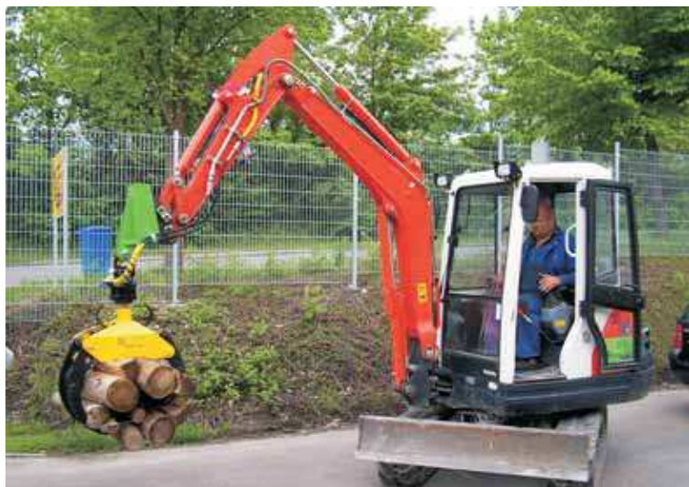
Montage sur mini-pelle avec accroche rapide