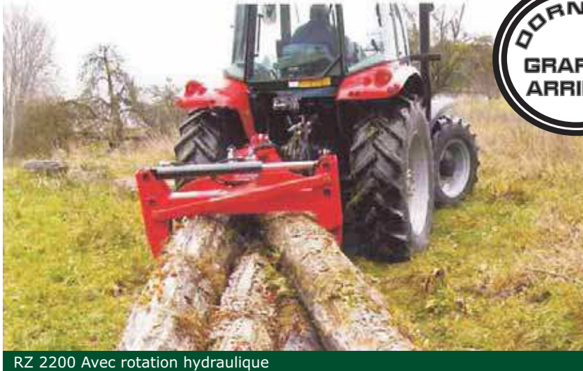
RZ 2200 Avec rotation hydraulique