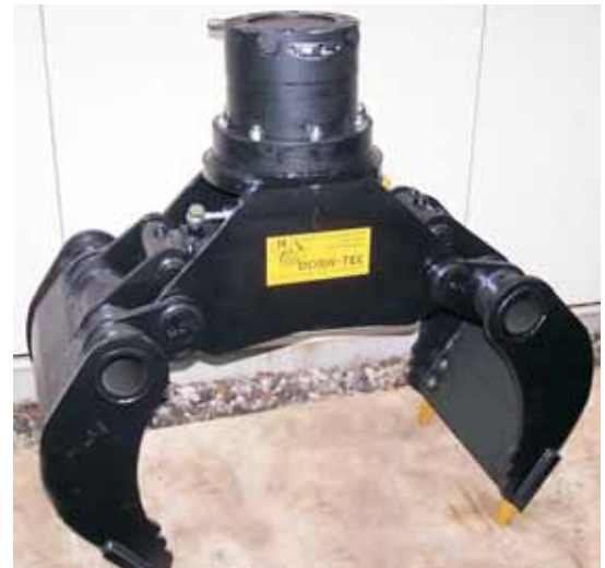
Série SG avec coquille fermée