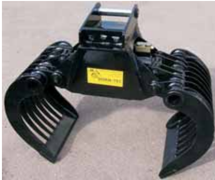
Série RC avec coquille avec barres